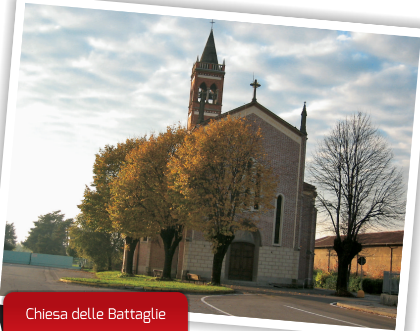
Chiesa delle Battaglie