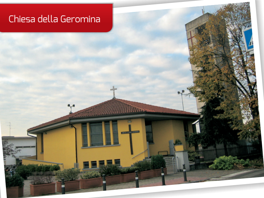
Chiesa della Geromina